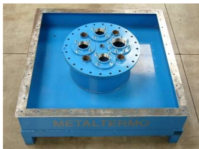
FIG.1) PULIRE ACCURATAMENTE LA FLANGIA DEL SEMIPOZZETTO DEL SERBATOIO