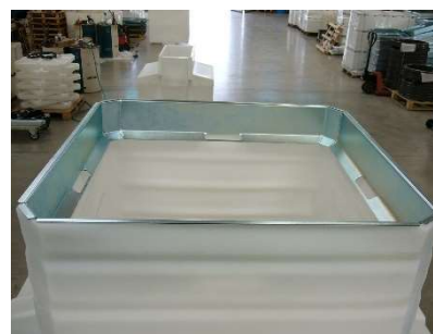
FIG.11) POSIZIONARE IL RINFORZO ZINCATO ALL'INTERNO DELLA PARTE REGOLABILE SUPERIORE