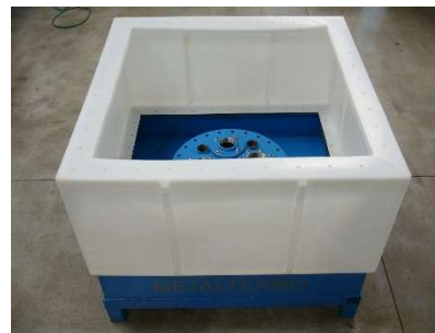
FIG.3) POSIZIONARE LA PARTE INFERIORE DEL POZZETTO SOPRA LA GUARNIZIONE