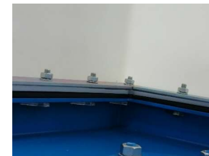
FIG.5) INSERIRE N°4 BARRE ZINCATE ALL'INTERNO DELLA BASE DEL POZZETTO E FISSARE CON RONDELLA E DADO