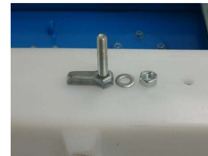
FIG.4) INSERIRE I BULLONI MOD. METALTERMO IN TUTTI I FORI TRA SEMIPOZZETTO E BASE