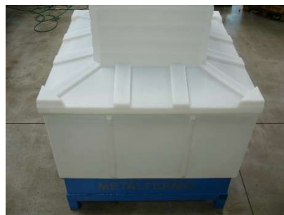
FIG.7) APPOGGIARE SOPRA LA GUARNIZIONE LA PARTE SUPERIORE DEL POZZETTO