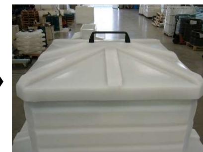
FIG.12) POSIZIONARE IL COPERCHIO DEL POZZETTO SOPRA IL RINFORZO, FINE MONTAGGIO.