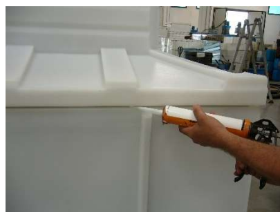
FIG.10) SIGILLARE CON APPOSITO SIGILLANTE L'ACCOPIATURA TRA BASE E PARTE SUPERIORE DEL POZZETTO