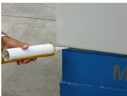
FIG.9) SIGILLARE CON APPOSITO SIGILLANTE L'ACCOPIATURA TRA SEMIPOZZETTO SERBATOIO E BASE POZZETTO